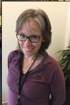
Marit Riktor Mammografi, CT og generell røntgen